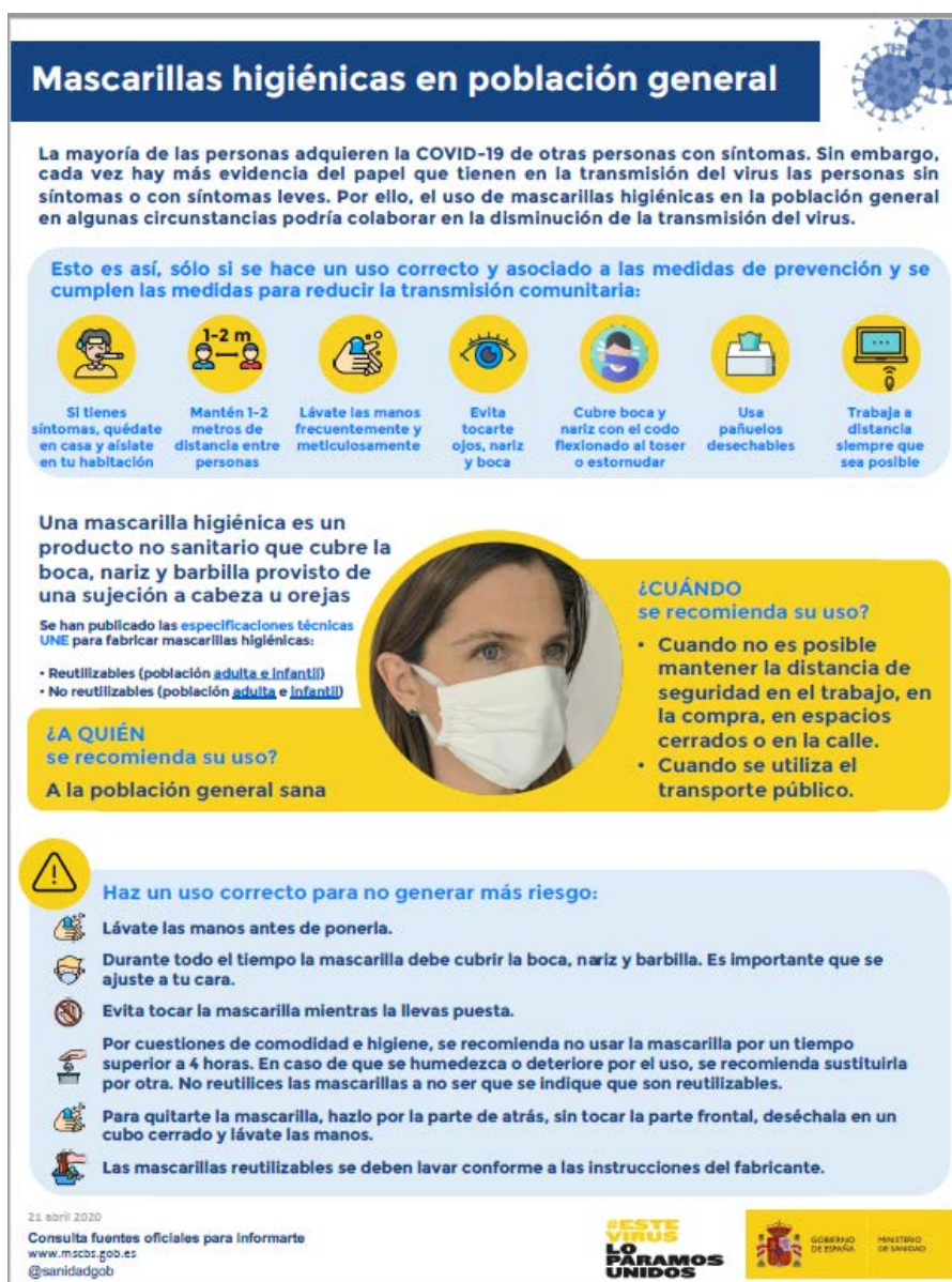
Mascarillas higiénicas en población general (Ministerio de Sanidad, Consumo y Bienestar Social, 2020)

Nota: las mascarillas quirúrgicas y las mascarillas higiénicas no son consideradas EPI.